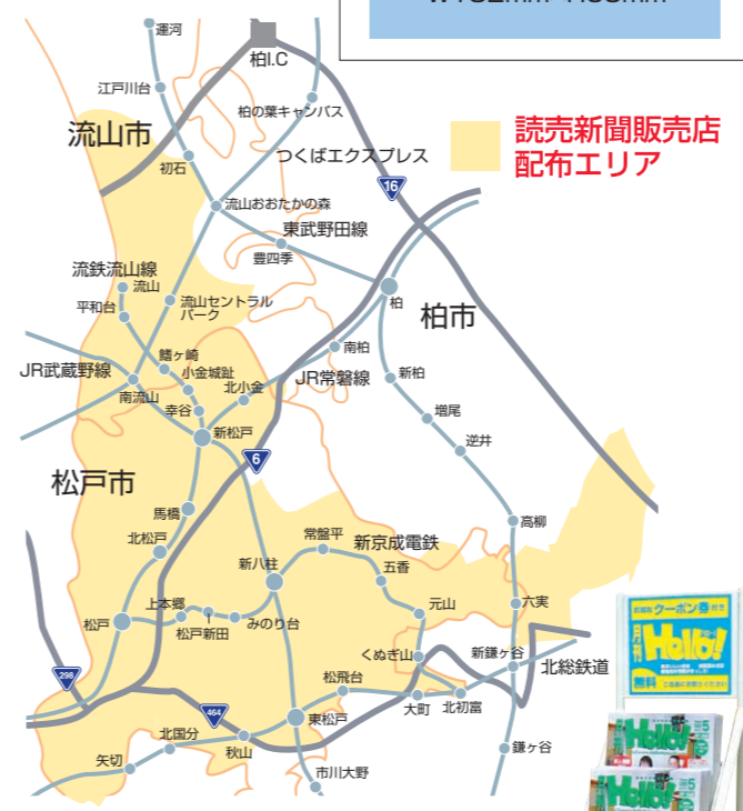
読売新聞販売店配布エリア

主要設置場所: ヨークプライス五香店 / イトーヨーカドー流山店・松戸店・八柱店・柏店 / イオン北小金店1Fサービスカウンター / 新東京病院 / 聖徳大学 / 東葛ペット / 常盤平ボウリングセンター / 流山市役所 / 流山市文化会館 / 流山商工会議所 / ハローマート北松戸店・南増尾店 / 松戸商工会議所 / マツモトキヨシ八柱駅前店 / 森のホール21 / らんらん俱樂部 / 湯楽の里 / 新松戸中央総合病院 / 松戸南部市場内 / 西友常盤平店内学友堂 / 流鉄流山線 流山駅 / 松戸東自動車学校 / ユニティ松戸常盤平店 / 五香病院 他多数