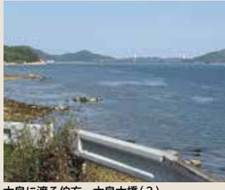
大島に渡る伯方・大島大橋(?)

筆者プロフィール: 50代、身長168cm、体重81kg。夏でも病気以外で食欲が減退したことはありません。糖尿病と交戦中。