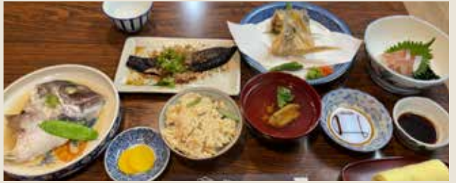
食事が思っていたよりすくてお腹いっぱいです。