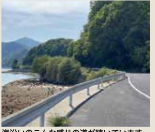
海沿いのこんな感じの道が続いています。