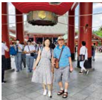
※このコーナーへのご意見やご感想をメール、FAX、おたよりにてお寄せください。(送り先月刊ハロー編集部)

円、黄さんの奥さんは大人料金五百円が入った。富浦は既に盛りを過ぎていたが、あちこちに鮮やかな紫色の花が残り咲き続けていた。紫陽花は雨水不足で大分色が褪せていたが、結構多くの入園者が賑わっていた。今回の鉄道旅行は平日でもあり、往復とも座席が確保できたのは運が良かった。渋谷に戻り、私は黄さん夫婦をつづめグリルへ案内した。この売りはハンバーグステーキだが黄さんは鮭のステーキを注文した。近頃の黄さんの生活について訪ねると、彼は幼い頃の交友と年に数回海外旅行するのだと言った。黄さんの家には三匹の猫がいて、壁に沿って作られたそれぞれの寝床を専用しているのだそうだ。