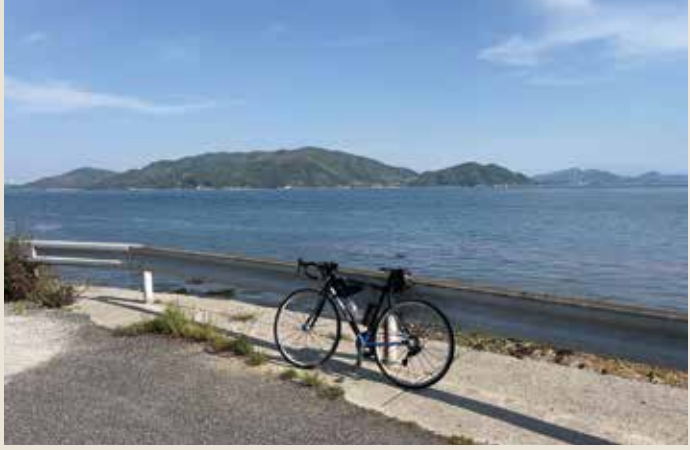
正面に見える島が大島です。今はまだ見えていませんが奥に本日泊まる伯方島があると思われます。

しまなみ街道: 1日目③ 大山祇神社を出て、大三島の外周コースへ。大三島の外周をきちんと周ろうと思っていたのですが、思っていたより疲れを感じたので島の左下の方は周らずショートカットして大三島環状線に出る道を通り、伯方島の宿を目指しました。大三島環状線(外周コース)は人も車もあまり通らず、案内穴場かもしれません。走行距離は増えますが、のんびり行かれる方にはおすすめだと思います。右上の写真は伯方島に渡る大三島橋と思っていたのですが大島に渡る伯方・大島大橋のようです。間違っていたらすみません。伯方島で泊まった宿がとてもユニークな宿でした。和式の部屋なのですが鍵が錠前で止める形式でした。1泊8,800円の2食付きなのですが料理が思っていたより豪華で鯛づくし! ご飯も白飯と鯛めしもあって大満足です。いつもはビジネスホテルなのですがたまにはビジネスホテル以外もよいものですね。