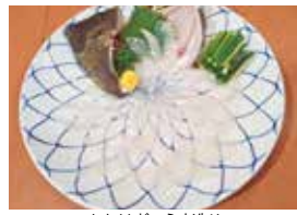
かわはぎのうす造り