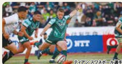
ティアンスワネボール選手

またジュニア会員になって頂けると試合チケットが無料となります! QRコードを読み込んで、柏の葉を満員にしましょう!!