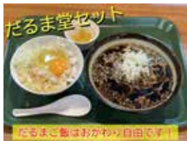
だるま堂セット 650円。天かす入りのTKGとおそばのセットです。特製醤油でお召し上がりください。