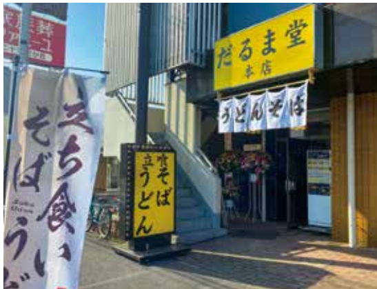
きいろの大きな看板が目印! 大人気の漆黒濃口関東そばが味わえるお店です。