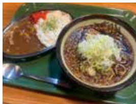
ミニホルモンカレーセット(そば・うどん付) 740円。新メニューのコク深いホルモンカレーの弾力ある食感をお楽しみください。