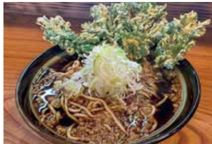
春菊天(そば・うどん) 490円。ボリューム満点の大きな春菊天のサクサクとろろ食感をお楽しみください。