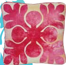
クッションカバー

ハワイの美しい自然をモチーフに 鮮やかな色彩を組み合わせて、小物やタペストリーなど ハワイアン気分でゆっくりと仕上げていきます。