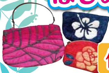
ミニバッグ・ポーチ