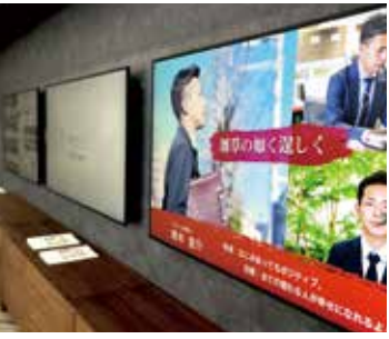
大型液晶ディスプレイ