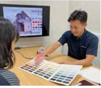
豊富なカタログやサンプル

ご自宅の写真を使い、※1色をシミュレーションすることができます!(無料) サンプルだけではイメージがしづらい