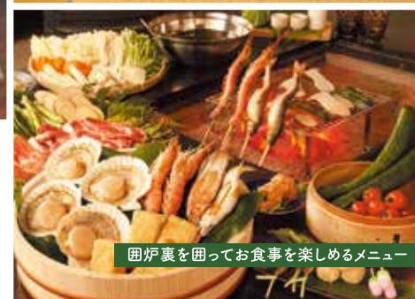
囲炉裏を囲ってお食事を楽しめるメニュー