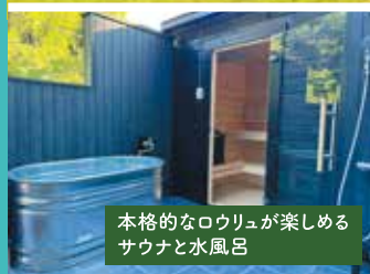
本格的なロウリュウが楽しめるサウナと水風呂