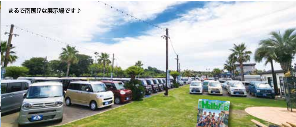
まるで南国!?な展示場です!