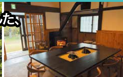
ゆったりとした空間で、最大10名まで宿泊可能。家族や友人と過ごす特別なひとときを提供します。