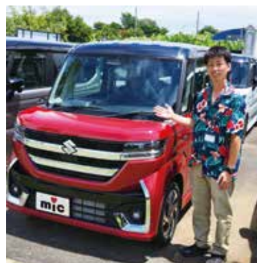
カスタム車も豊富に用意しています!

「これで中古車?」と思ってしまう車もいくつかありました! また整備工場完備なので購入・納車までが早いと好評です! 某車購入サイトででもレビューが最高の☆5つなもうなげます。 中古車選びを失敗したくない方、色々なお店を回ってみるのも良いですが、まずはここミックオートガーデン松戸さんへぜひ足を運んでみてください! そして今回、月刊ハロー限定で嬉しい「来店プレゼント」と「成約プレゼント」を大放し! この機会をぜひお見逃しなく!