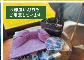
お部屋に浴衣をご用意しています