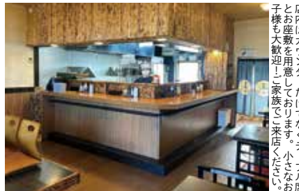
店内はカウンターだけでなくテーブル席とお座敷を用意しております。小さなお子様も大歓迎!家族でご来店ください。

松戸の有名店として2年目を迎える当店は、オープンから現在に至るまで立ち食いそばファンと言われる多くの方々や、「濃口つゆなに?」と興味を持ってこ来店いただいた方々の期待を裏切らず、存分にその舌と腹をみたくしているのだ! だるま堂本店を運営する会社のオーナーは大のそば好きで、さまざまな店を食べ歩いても自分好みの理想の味に出会えなかったことが、この店を作る大きなきつかけになったそうである。 とくにこの漆黒のつゆがすごかった! 毎朝特殊な技法で仕込みをしている自家製のつゆは作り置きせず、