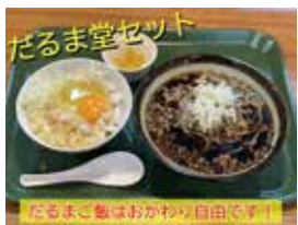
だるま堂セット 650円。天かす入りのTKGとおそばのセットです。特製醤油でお召し上がりください。