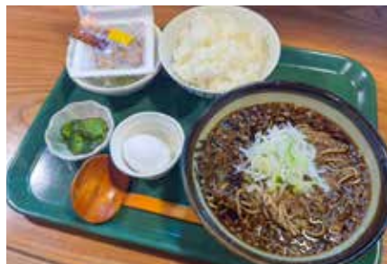
朝定セットはかけ(そば・うどん)と玉子かけご飯、納豆の満腹セット! 590円 ※ご飯・たまご・納豆は食べ放題ではありません。