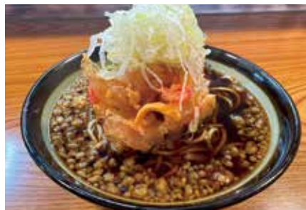
かきあげ天(そば・うどん) 490円。紅生姜と玉ねぎのパンチの効いたかき揚げ天は濃口つゆと相性抜群です。