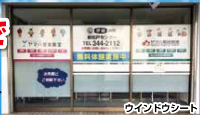
ウインドウシート

大型看板・電飾看板・ウインドウシート・スタンド看板 バックライトチャンネル文字 袖看板・野立看板・など