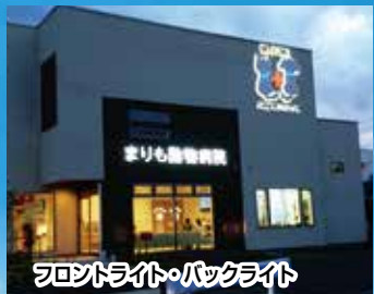
フロントライト・バックライト

大型看板・電飾看板・ウインドウシート・スタンド看板 バックライトチャンネル文字 袖看板・野立看板・など