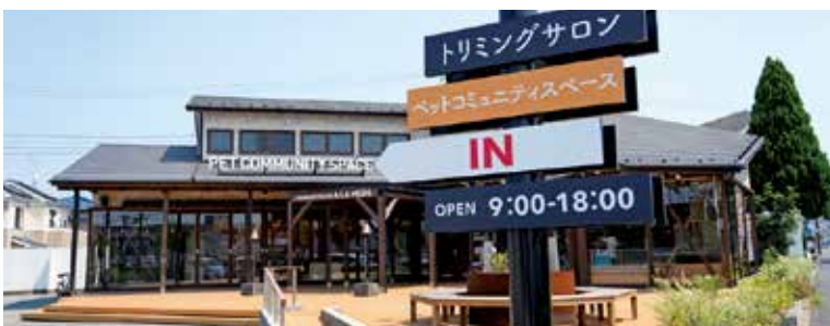
取材協力/保護譲渡施設「ペットと暮らそう」ペットコミュニティスペース 松戸市古ヶ崎763-1